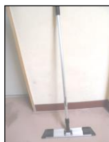
ワイパーで掃除し、シートは当面使い捨て