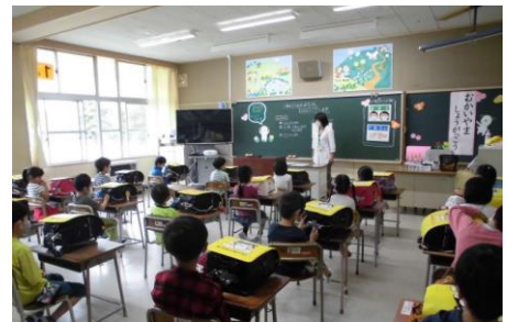
入学式はまだですが、しっかり登校1年生

安心安全な学校づくりに向けて準備をしておりますので、期待と楽しみを持たせて学校に送り出してください。