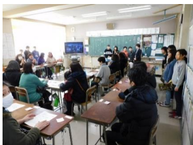
6年「感謝の気持ちを伝えよう」

さて過日は、今年度の最後となる授業参観及び懇談会に、お忙しい中大勢の皆様にお越しいただきありがとうございました。各学年の今年度の集大成の一端を御覧いただけたかと思えます。懇談会でもこの1年の成長を語り合うことができ、有意義な時間が持てましたことに感謝申し上げます。