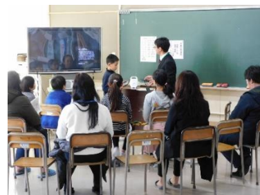
5年「宮城の食」一人一人が研究発表

6年生はいよいよ卒業に向けて、感謝の気持ちを表したり、小学校の思いをまとめ、下級生に伝えたりして、引き締まった表情が見られます。5年生も卒業生を送り出すため、下級生をまとめて準備を進めているところです。この時期は新年度への期待や不安などが様々入り混じっているようです。残り少ないこの時期を充実させるために、各学年頑張っております。引き続き御支援をお願いいたします。