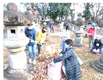
大年寺山伊達家歴代御廟清掃と伊達家の歴史講話

12月7日伊達家歴代御廟の清掃と歴史講話を聴く会や2学年の「まほろばの里」訪問等、今後も地域に学びふれ合いを大切にしていきます。