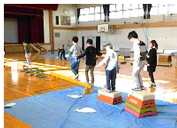
児童会行事「おもしろフェスティバル」

12月25日（水）から1月7日（火）まで、2週間の冬休みになります。「明るく・仲良く・根気よく」の合い言葉とおり、おかげさまで子供たちは元気に学校生活を送り、充実した活動をすることができました。これも保護者の皆様、地域の皆様の御支援・御協力の賜です。厚く御礼申し上げます。