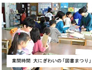
業間時間 大にぎわいの「図書まつり」

学習発表会以降も、児童会行事「おもしろフェスティバル」や学年行事、地域の行事など様々な活動がありました。「おもしろフェスティバル」では、4～6年生が、相手を楽しませるお店を様々な企画し、工夫があられたお店を開きました。「来年は上級生のようにやりたい」「とても楽しかったありがとう」の感想がたくさんあふれていました。図書委員会企画の「図書まつり」も大にぎわいで、楽しい企画があり、図書の貸し出しも倍増しました。イベントが好きで、参加だけではなく企画も上手な子供たちです。