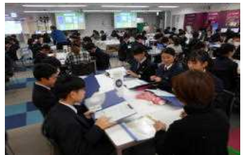
「ファイナンスパーク」