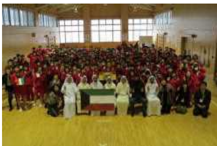
「クウェート交流会」