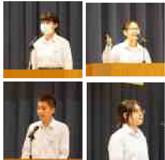
【英語暗唱・英語弁論・少年の主張・市弁論の発表者】 (文化発表会ステージ発表より)