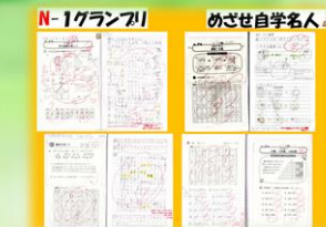
N-1クラブ! めざせ自学名人 自主学习ノート コンクール