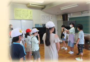
笑顔あふれる やさしい子