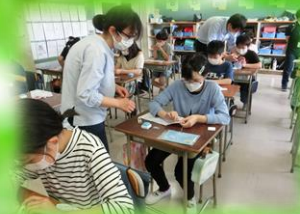
地域連携事業 学習支援ボランティア