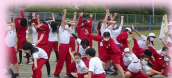
困難に負けない たくましい子

目指す児童像 困難に負けないたくましい子 すすんで学ぶ子 えがおあふれるやさしい子