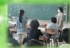
ソーシャル スキルアップタイム