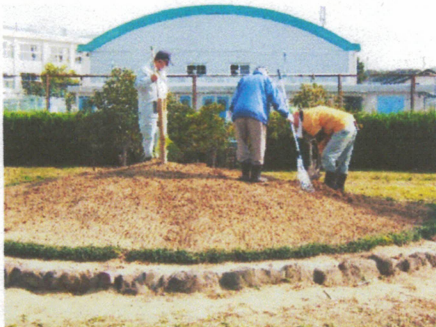
「ひまわり」の撤去状況