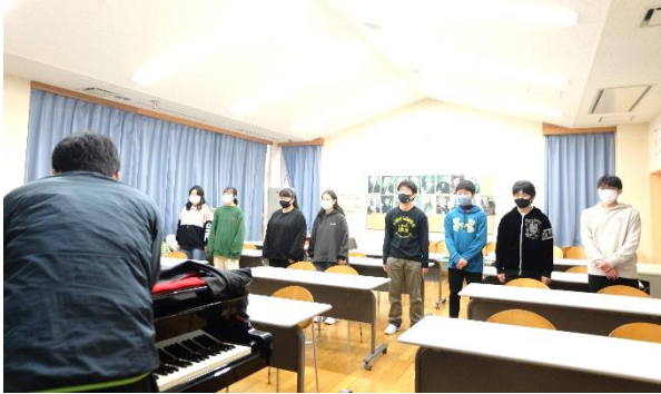
▲ 中学校生活も残りわずか。卒業の歌の練習が始まりました。