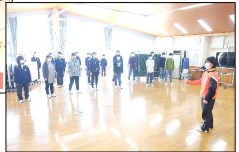
▶ 後輩たちも3年生を送る歌を練習中です。