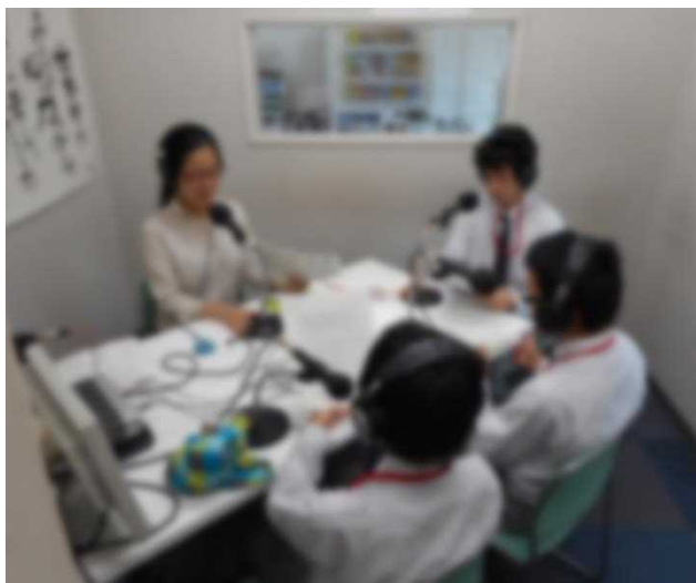
< FMたいはくの収録の様子 >