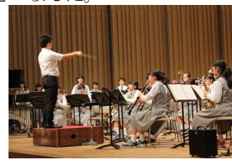
吹奏楽部アトラクション