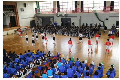
運動部紹介の様子（サッカー）

4月14日金曜日には対面式が行われました。生徒会役員の皆さんが中心となりながら、新入生に向け、生徒会組織の説明、生徒会役員の紹介や各種委員会の説明など、新入生予備登校時のQ&Aの回答について答えながら、ユーモアを交えながらの楽しい紹介となりました。また、部活動では、各部がそれぞれ工夫を凝らしながら、新入生を入部させようと頑張っていました。先輩から激励の言葉等が行われ、全校生徒全員で校歌を歌い、和やかな素敵な日となりました。