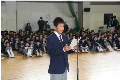
新入生代表のあいさつ