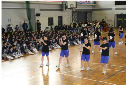
文化部紹介の様子（吹奏楽）