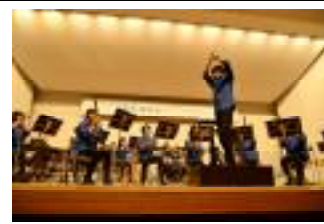
吹奏楽部は顧問だけでなく生徒も指揮者にチャレンジ！会場を盛り上げました。