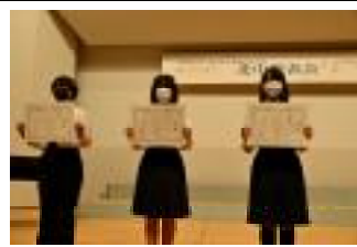
プログラムデザイン受賞の3名です。作品は会場1階ホールにも展示されました。