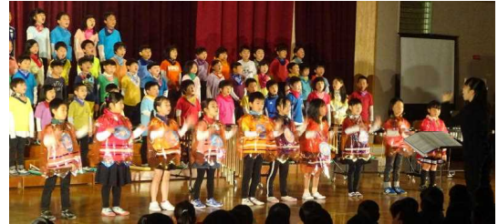
2年音楽「音楽のおくりもの～心を合わせて～」