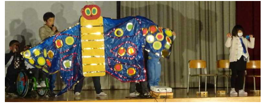
あおぞら音楽「はらぺこあおむし」

11月10日(土)、学習発表会一般の部が行われました。どの学年も、練習の成果を十分に発揮することができ、子供たちの表情は達成感に満ちておりました。学校行事は、子供たちが自信をつけ成長する機会となります。これからもお子さんの行事の時の頑張りを褒めてあげていただきたいと思ひます。