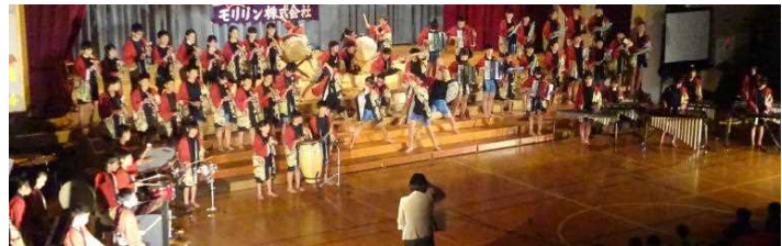
6年音楽「響～つなぐ心 つむぐ音～」