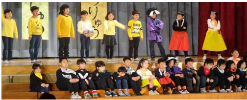
3年劇「どろぼう学校」