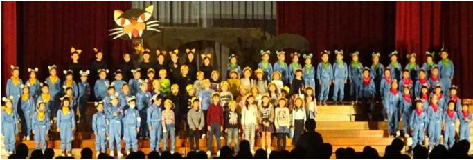
1年劇「ねこにすずをつけちゃった」