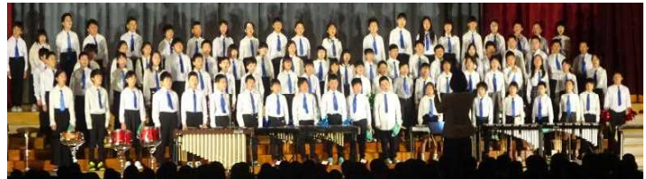
4年音楽「希望～今、わたしたちにできること～」