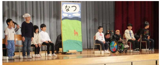
↑ あおぞら 音楽「里山の春・夏・秋・冬」