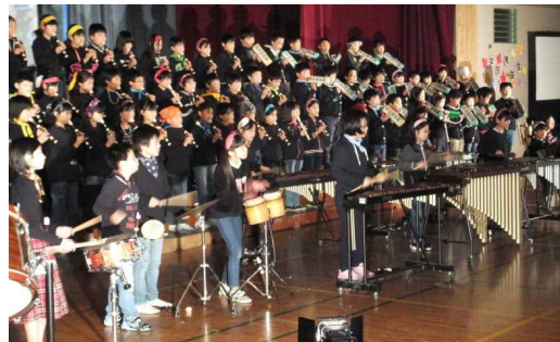
← 4年 音楽 「10才 ～夢に向かって～」