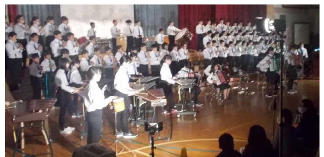
↑ 6年 音楽「プラネット オブ アース」