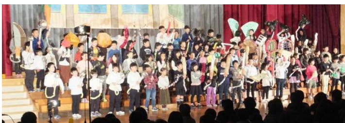
↑ 3年 劇「ふしぎなしっぽ」