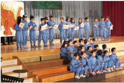
↑ 1年 劇「かわまえにんじやのぼうけん」