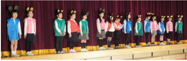
↑ 1年 開会の言葉

当日は、たくさんの来賓、地域の方、保護者の方で、体育館は立ち見が出るほどいっぱいになりました。どの学年も、練習の成果を十分に発揮することができ、子どもたちは満足そうでした。学校行事は、子どもたちが自信をつけ成長する機会となります。これからもお子さんの行事の時の頑張りを褒めてあげていただきたいと思います。