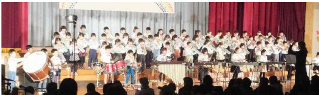
↑ 2年 音楽「Let's go 川前キッズ★」