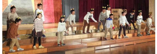
↑ 5年 音楽劇「ノラネコストーリー」