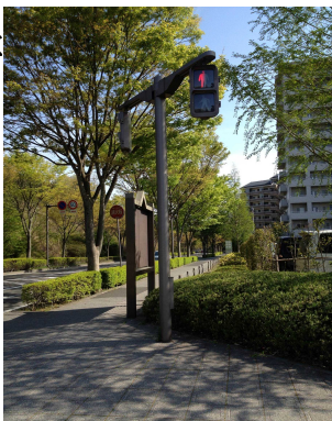
・がいがとうが少なく夜暗い。

じしんの時は、この信号きもいでんしました。車が来ないか、まがってくる車はいないか、いつでもしっかりとたしかめて渡ろう。