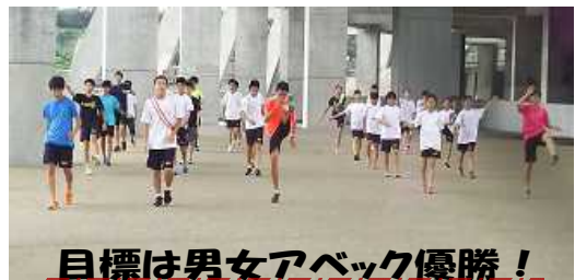
目標は男女アベック優勝！