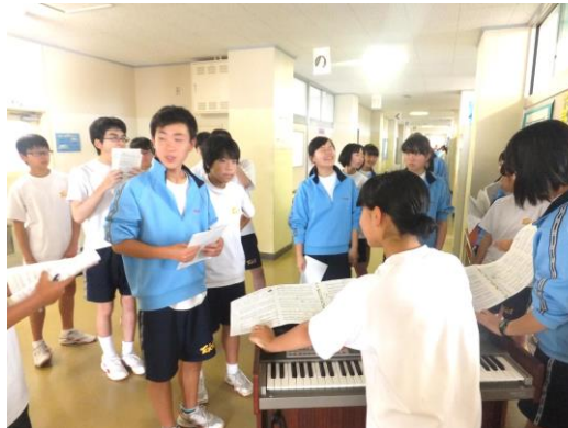
男女のパートで合わせてみます。