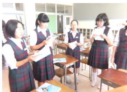
アルトパート練習