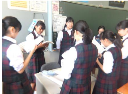
アルトパート練習