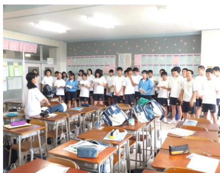
全員で合わせてみます。