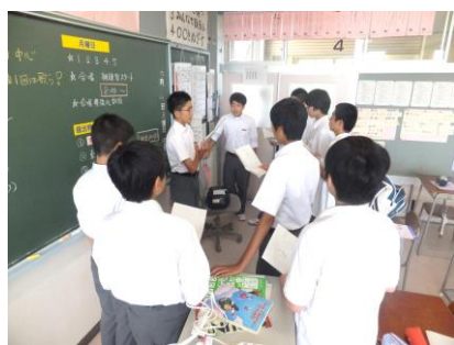
テノールパート練習

「3H&3-1」 3つのH（ハーモニー、ハート、ハッピー）と3つ（心、思い、学級）を一つにしようという思いが込められています。