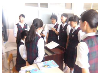
ソプラノパート練習