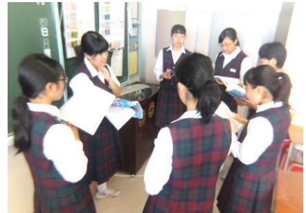
ソプラノパート練習