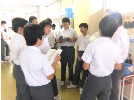
テノールパート練習