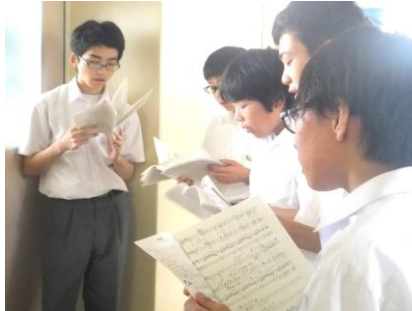
テノールパート練習