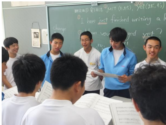
男子全員で合わせてみます。