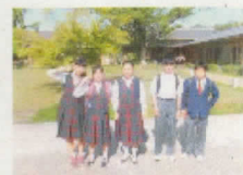
7班 宇治市観光協会 (鶴匠)