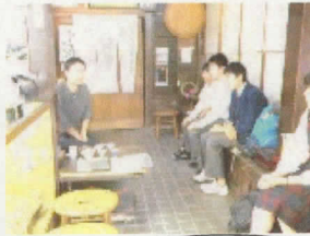
京都宇治茶房にて