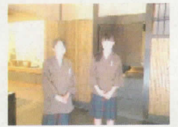
半兵衛麩のお店にて