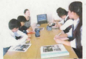
宇治市観光協会 鵜匠の方と