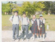
3班 株式会社 大佛