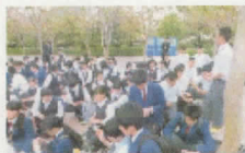
USJのチケットが配られます。