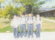
25班 祇園祭山鉾連合会