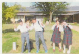
5班 玉置美術刀剣研磨処