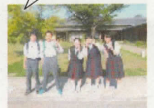
8班 通圓 宇治本店