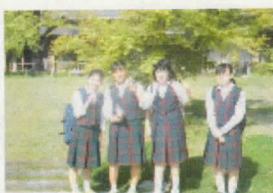
17班 いもぼう 平野家総本家