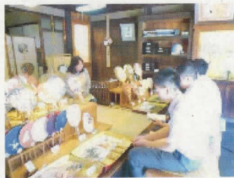
京うちわ阿以波にて