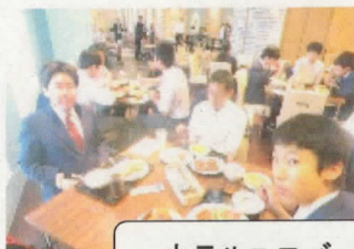
ホテルユニバーサルポートでの朝食

修学旅行最終日27日(水)は、生徒たちが楽しみにしていたUSJでの活動です。入園と同時に生徒たちはお目当てのアトラクションに走ったり、家族や後輩へのお土産を買ったりと、USJを満喫しました。心配していた雨もなんとか持ちこたえ、生徒たちはたくさんのお土産と思い出を抱え、伊丹空港から仙台への帰途に就きました。19時過ぎ、懐かしい仙台の街の灯が生徒たちを迎えてくれました。