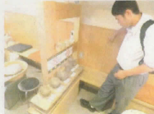
瑞光窯にて 清水焼の見事な 作品