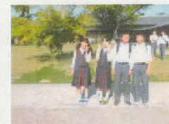
4班 山ばな平八茶屋