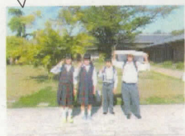
13班 あしだや中山人形店