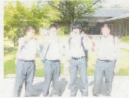
27班 京うちわ阿以波