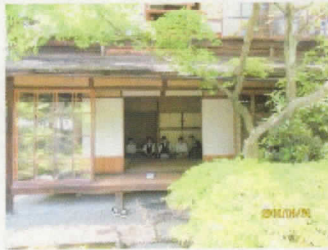
造園 植冶にて 庭師の方の話を聞きます。