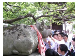
天神様ゆかりの撫で牛