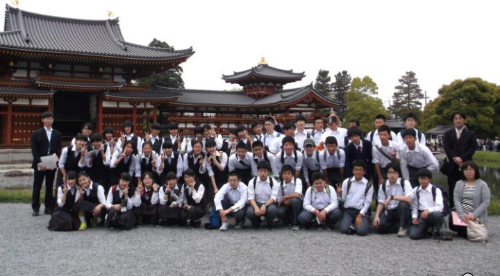
Aコース全員集合！～鳳凰堂前にて