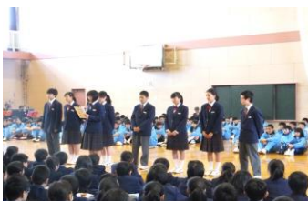
生徒会執行部の紹介