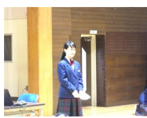
修学旅行実行委員の皆さんによるしおりの読み合わせ