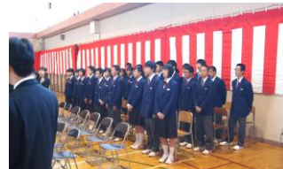
参列生徒の皆さん