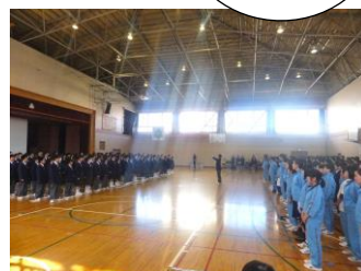
これからよろしくお願いします