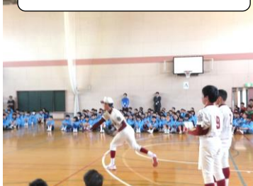
エースO君の剛速球

大きめの制服に身を包み、ちょっと緊張気味の新入生の姿に、2年前の入学式が思い出されました。今は頼もしいお兄さん、お姉さんとして、1年生を迎えました。