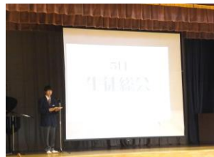
生徒会活動の紹介

大きめの制服に身を包み、ちょっと緊張気味の新入生の姿に、2年前の入学式が思い出されました。今は頼もしいお兄さん、お姉さんとして、1年生を迎えました。