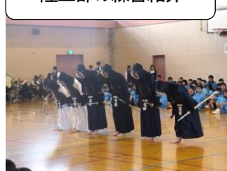
すがすがしい挨拶～剣道部