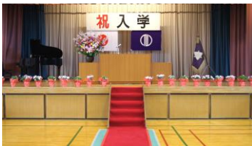
会場準備頑張りました

また4月15日（金）には、対面式が行われました。昨年度から生徒会を中心に、計画や準備を進めてきたものです。生徒会、委員会活動の紹介、部活動紹介など、さまざまな場面で3年生が活躍し、対面式を盛り上げました。この1年生が入学して初めて全学年が一同に会したわけです。3年生の生徒たちにとって、いよいよ本当の意味での最高学年の生活が始まりました。生徒たちには後輩の良きお手本として、一層頑張ってもらいたいと思います。