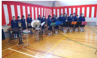
吹奏楽部の皆さん