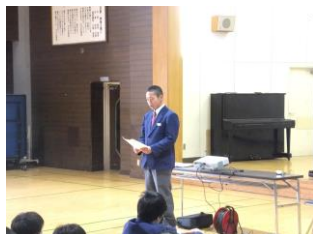
学年協議委員長Y君の挨拶

4月15日（金）に、学年協議委員と修学旅行実行委員による学年集会が行われました。3年生になって選ばれた新学年協議委員の運営による学年集会では、最高学年としての目標や抱負を確認し合いました。学年協議委員の声掛けのもと、整然とした真剣な雰囲気で集会が進行しました。その後、修学旅行実行委員によるしおりの読み合わせの集会がありました。生徒たちは近づく修学旅行への期待を胸に、時折メモを取りながら熱心にしおりに目を通していました。学年集会を通して、リーダーの活躍はもちろん、それを支えるフォロアーの成長を強く感じることができました。