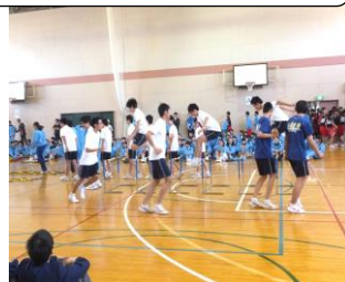
陸上部の練習紹介

対面式の部活動紹介では、各部工夫を凝らした紹介、パフォーマンスを披露しました。先輩たちのカッコいい姿に、1年生は目を輝かせていました。