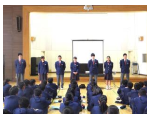
学年協議委員の皆さん