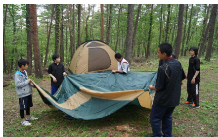
テントを張らねば今夜は寝れません