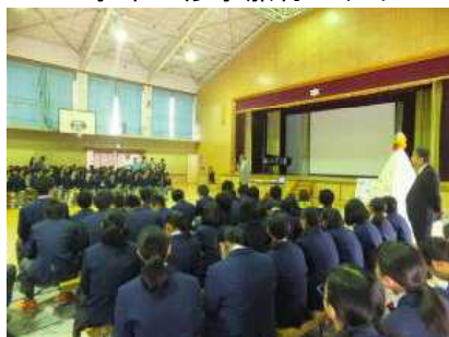
太秦中との交流会