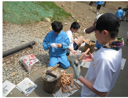
野外炊飯で薪を小さくしています