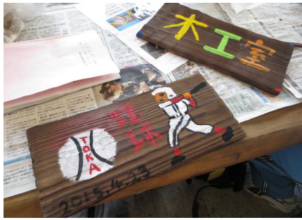
焼き板 いい感じにできました