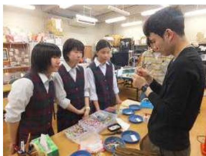
自主研修での体験