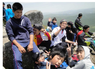
山頂でお弁当です