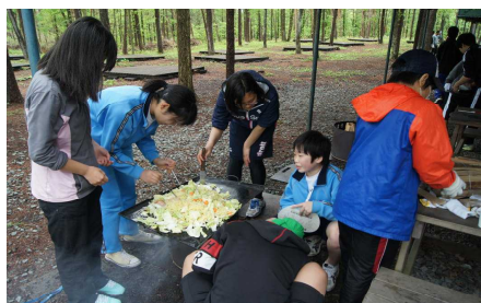
野外炊飯 焼きそばを作ります