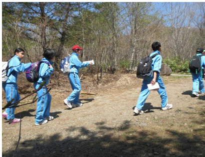
木立の中でオリエンテーリング