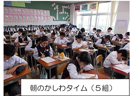
朝のかしわタイム（5組）