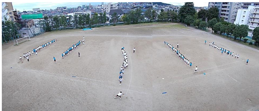
大縄練習（左から）5, 4, 3, 2, 1組