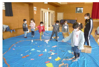
1・2年フェスティバル