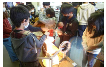
4・6年エネルギー出前授業