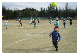
4・5・6年巡回サッカー教室