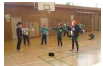
6年よさこい練習(宮学ボウ)