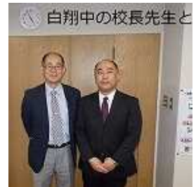
左が本校校長です。