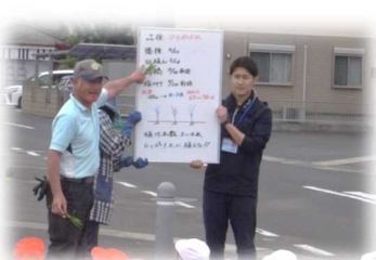
▲蒲っこ田んぼの先生