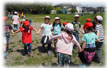
▲遠見塚古墳で仲よく遊ぶ1・2年生

一方、登下校時に空き地に入って石投げをして遊んでいる児童がいるとの連絡もいただきました。通学路を通ること、遊び方については学校でもあらためて指導しましたが、地域の方から注意していただくことも大切な勉強であり、学びですので、子供たちの間違った活動を見かけましたら是非声をかけて注意していただきたいと思います。