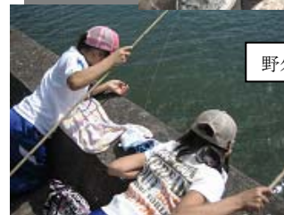
野外炊飯・カニ釣りの様子