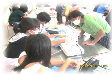
ミシンボランティアの皆様により5年生の家庭科の授業に入っていました。

なお、10月6日(火)は授業参観となっております。感染症対策をしながらになりますが、ぜひ子供たちの成長の様子をご覧くださいと存じます。また、その後、懇談会も予定されています。多くの保護者の皆様の参加をお待ちしております。