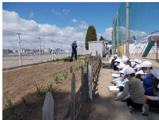
赤間さんの話をしっかり聞いています。