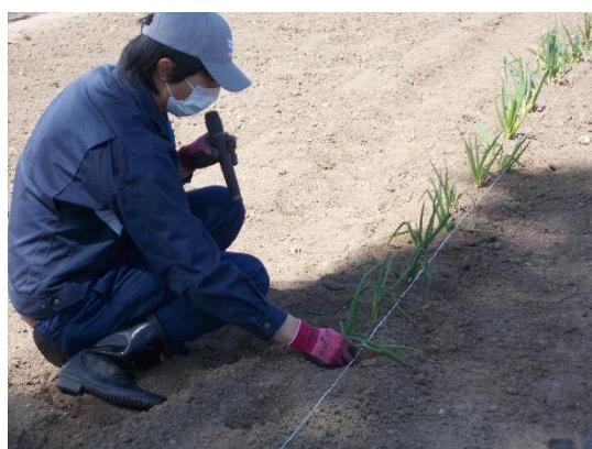
移植の仕方を丁寧に説明してくれています。