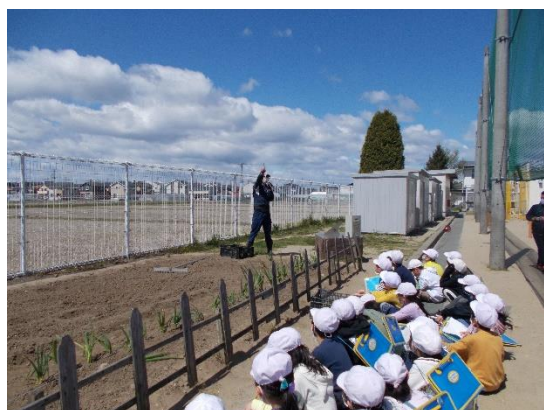
天気に恵まれました。