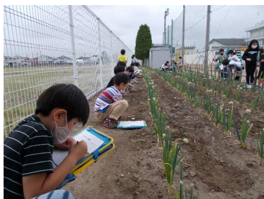
ネギの生育が楽しみです。