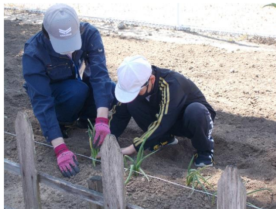
こうやって移植するんだね。