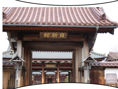
会津日新館です。武士が出てきそうな佇まいです。