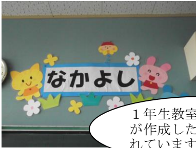
1年生教室です。2年生が作成した作品も掲示されています。