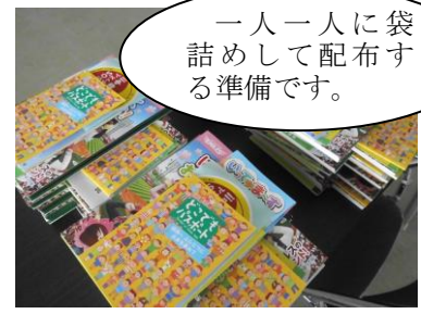
一人一人に袋詰めして配布する準備です。

新1年生を迎える準備を教職員全員で行っています。準備の計画は、入学式のおよそ3か月前から立てます。春休みは、教科書を確認したり、教室の掲示をしたり、毎日準備作業を行いました。