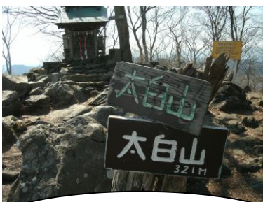
太白山山頂です。木々の間から人來田の住宅地が見えます。

1年生：太白公園 2年生：茂庭荘 3年生：太白山自然観察の森 4年生：太白山登山 5年生：白石市内 6年生：仙台市内自主研修