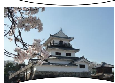
春の白石城です。下見の日に桜が満開だったそうです。