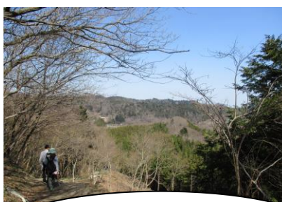
太白山自然観察の森、遊歩道です。ながめが最高です。