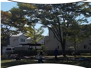
太白公園です。1年生ががんばって歩きます。