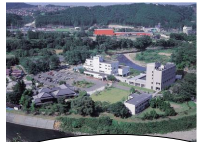
茂庭荘です。帰りは上り坂になるので汗をかきます。