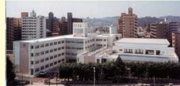
現在の五橋中 (東側より)