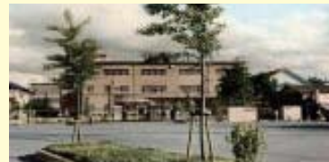
旧校舎 (昭和30年代) 北側より