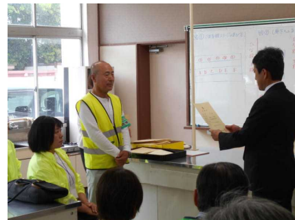
写真は委嘱状交付式の様子

ボランティア防犯巡視員の方々の紹介式を通して、子供たちは改めて、「自分たちはたくさんの地域みなさんに温かく見守られている」ということを実感できたことと思います。安全に気を付ける心情と態度を身につけることができるよう、学校でもより一層の声がけをしていきたいと思っております。ご参加いただいた皆様、本当にありがとうございました。