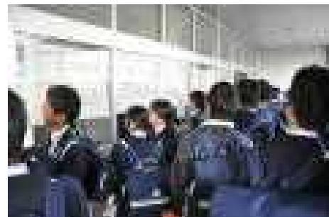
【クラス発表の様子】

4月10日の始業式、7人の新しい先生方を迎え、新たな気持ちで2年生がスタートしました。校長先生からは「理想とする自分を現実の形にするために充実した1年間を過ごしてほしい。2年生は先輩として1年生の見本となしてほしい」という話がありました。この言葉を受けてその日の午後の入学式の準備や翌日行われた入学式では先輩としての自覚が見られ、ひたむきに取り組む姿はとても頼もしく見えました。