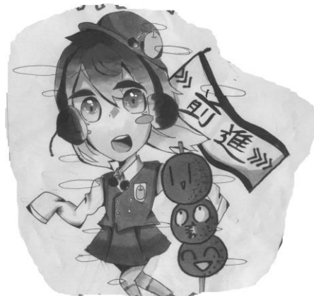
「ランちゃんとやく太郎」

1組 ████████ さん作 他にも兄弟が……。3組 ████████ さん作 隠された秘密が次点に2組 ████████ さん作の「山P」等おもしろいキャラクターがありました。