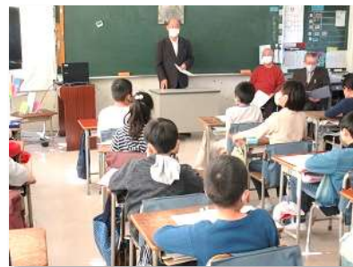
3年生がゲストティチャーから話を聞く場面 長命ヶ丘地区から、3名の方においでいただき 愛の鐘公園や、他の地域の様子を聞きました。