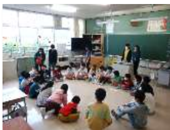
たて割り活動では、1～6年が各班に分かれて、短時間で活動します。

そして、まだこのコロナ禍にありながらも、来年度の取組をどのようにしていったらよいか検討する時期になるのですが、令和3年度入学予定児の就学時健康診断が11月中旬に行われます。例年、本校の5年児童がお世話をする場面があったのですが、今年度は保護者とお子さんのみ、他は教職員、学校医で対応します。5年児童は来年度6年生になります。この時期から、迎え入れる新1年生とのつながりを持ち、来年度の児童会活動の取組に向けて一歩進めたい意図があるからですが、今年度は中止せざるを得ない状況です。年度当初、お伝えしたとおり、これまで安全・安心で、日常的な学校生活を送ることを第一に考えて、中止するもの、工夫改善するものを取捨選択して行ってきました。現状から、なかなか難しいものもあります。秋も深まるこの時期ですが、子供たちの活動に対しまして様々なところで今後もご理解とご協力をお願いします。