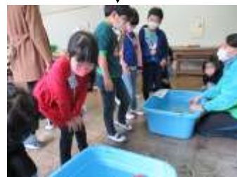
うみの杜水族館の出前授業(6年対象)で、海の生き物を2年生にも見せていただきました。