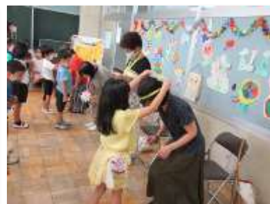
小1生活・学習サポーターさん 今までありがとう！(1年生)