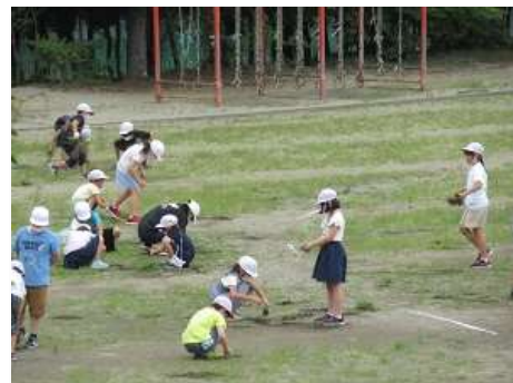
写真は3年草取りの様子(7/30ブログより)

○「校庭の草取りをします」という業間休みの急な放送に一所懸命草を取ってくれた子供たち。中には、「校長先生、こんなにとったよ」と山盛りの草を見せてくれた何人かの2年生。「ありがとうね、とっても使いやすい校庭になったよ」と声を掛けたところでチャイムが・・・。「手洗いしなくちゃ」と教室へ戻る子供たちの後には山盛りの雑草が・・・もちろん、気持ちよく袋へ詰め込みました。