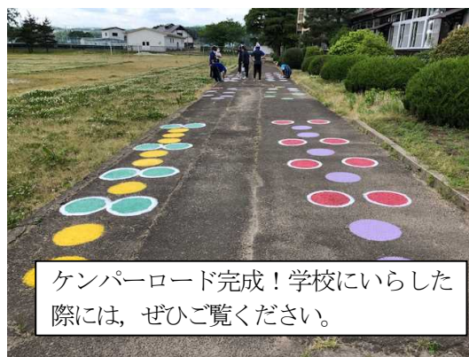
ケンパーロード完成!学校にいらした際には、ぜひご覧ください。

「運動の日常化大作戦!」の1つです。子供たちが遊びながら体力の向上を図ることができればうれしいと思っています。