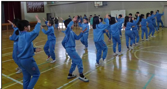
アセ踊りも4年生に引き継がれました。5年生の頼もしさもぐんと増し、転入児童も頑張っています。

3月15日(金)、根白石小学校では6年生17名が卒業の日を迎えます。これまで学校の柱として様々な場面で活躍してくれた6年生。その姿を見てきた下級生は、6年生が卒業していくことに不安や寂しさを感じているようです。12月には6年生は委員会活動での役目を終え、1月からは4・5年生が中心となって活動を進めています。今では4年生も大分仕事に慣れ、とても意欲的に取り組んでいます。6年生から渡されたバトンをしっかり受け止め、先輩たちが築いてきた根白石小学校の良さを更に高めていってくださることでしょう。