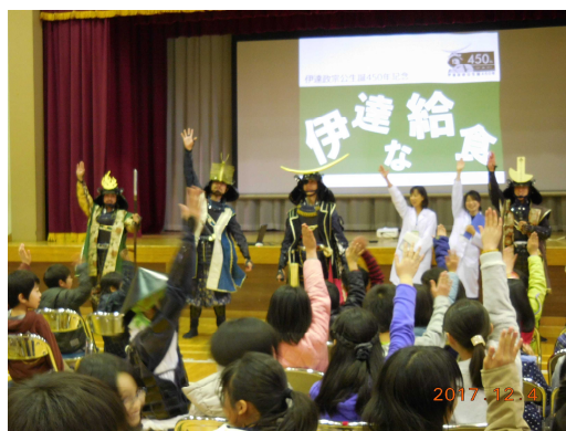
12月4日 「伊達な給食の日」