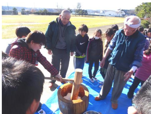
12月8日 4・5年「収穫祭 (もちつき)」