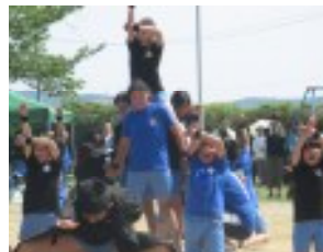
力強く、躍動的な演技を披露し た、5・6年生