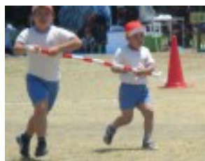
知恵と力で真つ向勝負の3・4年 生。