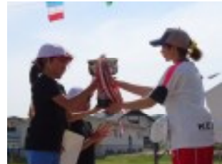
4度目の優勝を果たした中町地 区。おめでとうございます！