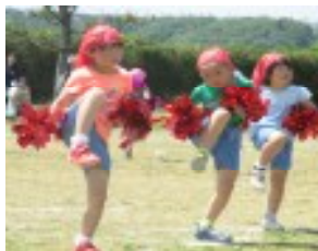
きれいのいダンスを披露した 1・2年生。