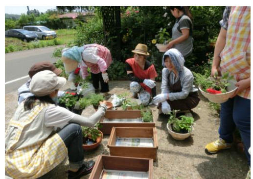
社会学級:講師宅の庭先で寄せ植えを体験しました。

3週こわたって、朗読朝会を行いました。どの学年も声の大きさや速さ、登場人物の心情などをよく考えて、上手に表現していました。これも、根白石小学校ならではの、特色ある活動の一つです。