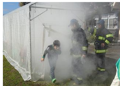
「口と鼻をしっかりとふさぎ、体を低くして！」消防署の方から煙から身を守る方法を教わりました。

11月5日(水)、火災を想定した避難訓練を実施しました。当日は泉消防署から署員の方々にお出でいただき、消火訓練や煙体験などを行いました。また、11月10日(月)には「故郷復興プロジェクト」の一環として、東日本大震災から学んだことを振り返り、防災・減災の重要性和家族・地域住民の協力の大切さを確認しました。さらに地域では、11月3日(月)に根白石地区防災訓練が行われ、本校の子どもたちも参加しました。日頃の備えや万が一の場合の対処などについて、体験を通して学ぶ貴重な機会となりました。