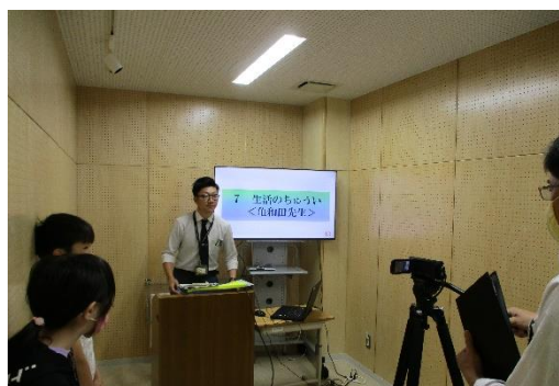
放送室からテレビを通じての始業式

これからも感染症対策を施しながら荒井小学校ならではの教育活動を子供たちとともに作り上げていきたいと思えます。