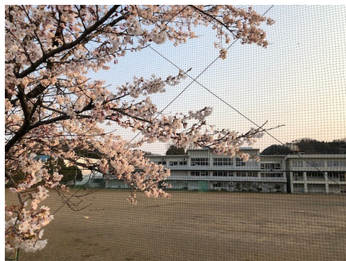
今年の秋保中の桜(4月15日撮影)

その先輩達と築き上げてきた、お互いを応援し、仲間を大切に、周りのために何ができるのかを優先する雰囲気大切にしてください。そこからは、いじめは絶対に生まれません。これからもみんなで新型コロナウイルスに立ち向かい、喜びや悲しみを分かち合いながら頑張っていきましょう。