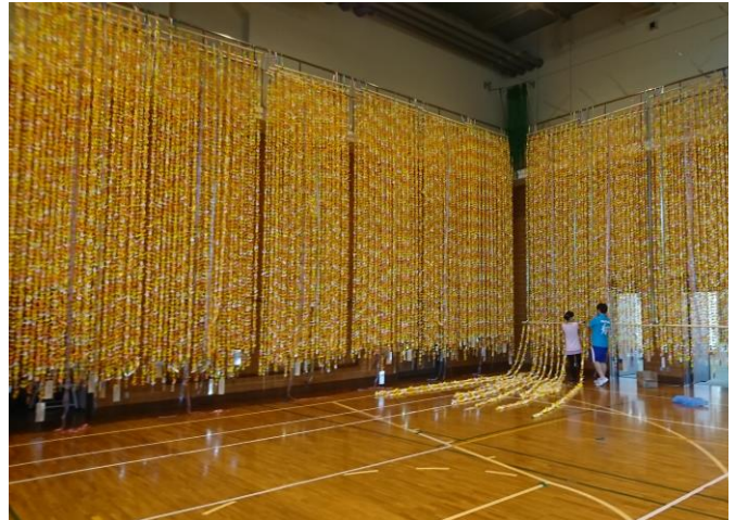
『児童生徒による 88000羽の七夕飾り』2017.8.6～8