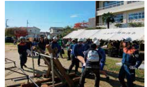
地域の方々と合同防災訓練（郡山中）