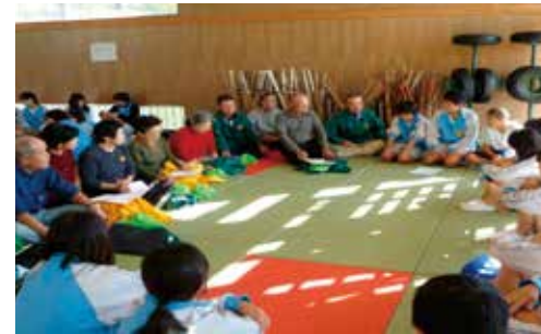
地域の方々が中学生に期待することは（南小泉中）