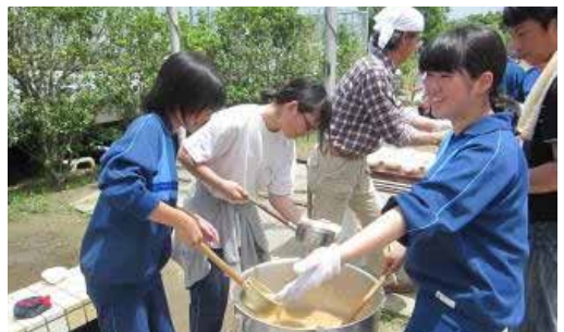
非常時に備えた炊き出し訓練（長命ヶ丘中）