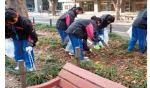
私たちの町は私たちの手で（南吉成中）