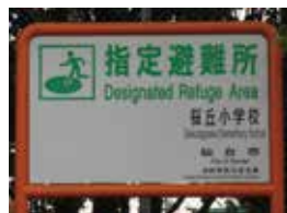
ひなんじよのかんばん

交番，しょうぼうしょ，AED，こうしゅう電話，高いたてもの，こうしゅうトイレ など