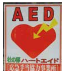
AEDが置いてあるしるし (AEDは心ぞうの正しい動きをとれどすきかい)