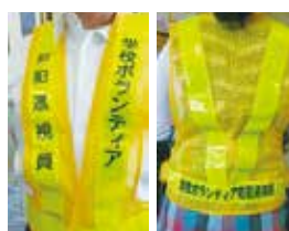
地いきのボランティアさん