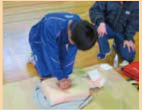
心肺蘇生を学ぶ (南光台東中)

緊急要請が集中する災害時は、救急車がすぐに到着することは期待できないため、医療機関に引き継ぐまでの間に自分たちでできる応急処置をしなければならない。特に呼吸や心臓が止まった人の命は、いかに早い段階で応急手当を開始するかが生死を大きく左右する。